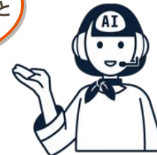
AIスタッフ“さゆり” ebica | LINE AiCall